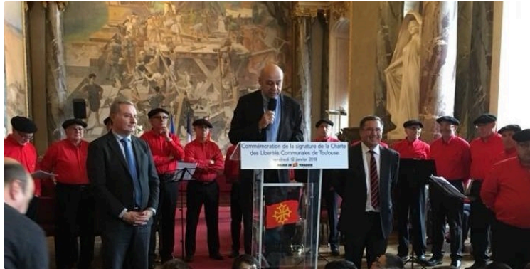
829ème anniversaire de la Charte des Libertés de Toulouse

8ème centenaire de la victoire des Occitans et des toulousains