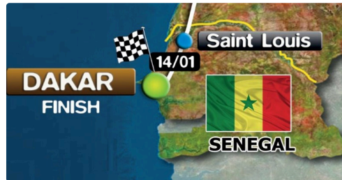
l'étape du jour