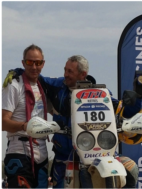
joie et amitié