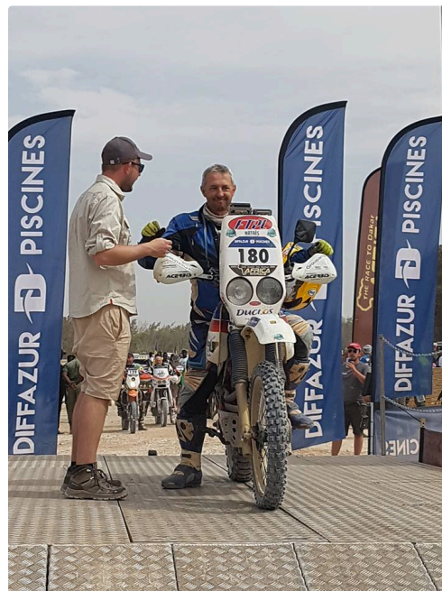
départ en ligne.jpg