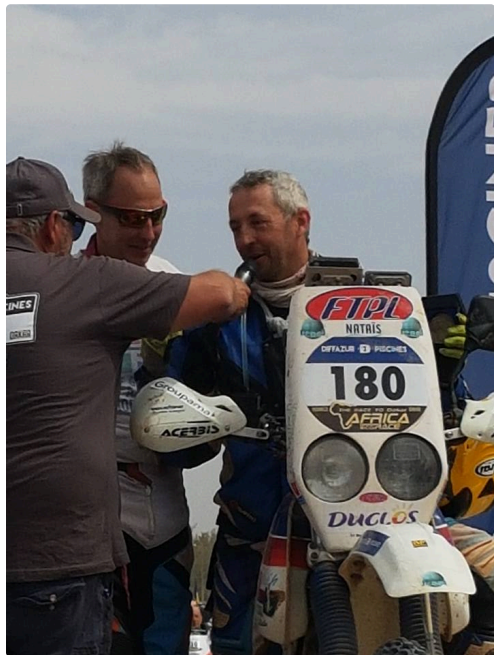
le sourire y est