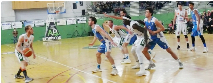
Basket-Ball : Pathétique VCGB

Malgré la débauche d'énergie déployée par certains joueurs, Valence-Condom s'incline lors d'un désastreux dernier quart temps