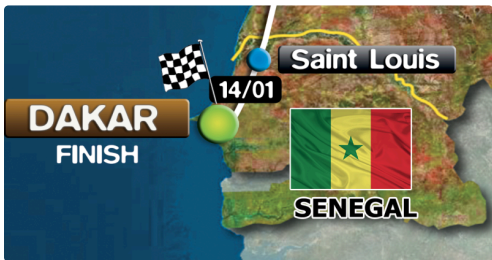
l'étape finale au lac rose