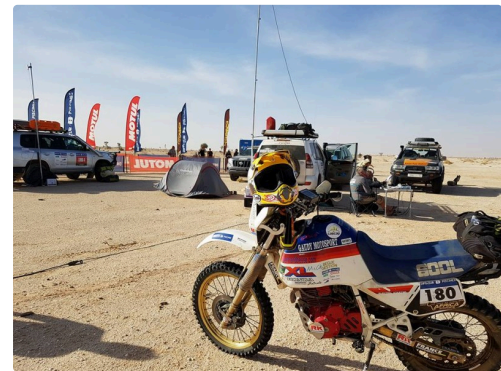
la N° 180 jusqu'au bout