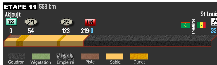
Africa eco race 2018 : étape 11 du 13 janvier