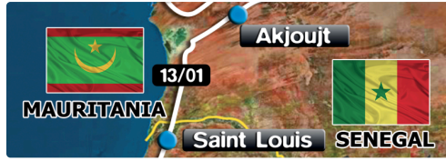
l'étape du jour