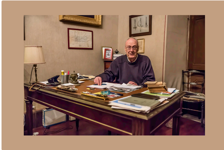
Perchède – Un trésor littéraire armagnacais...