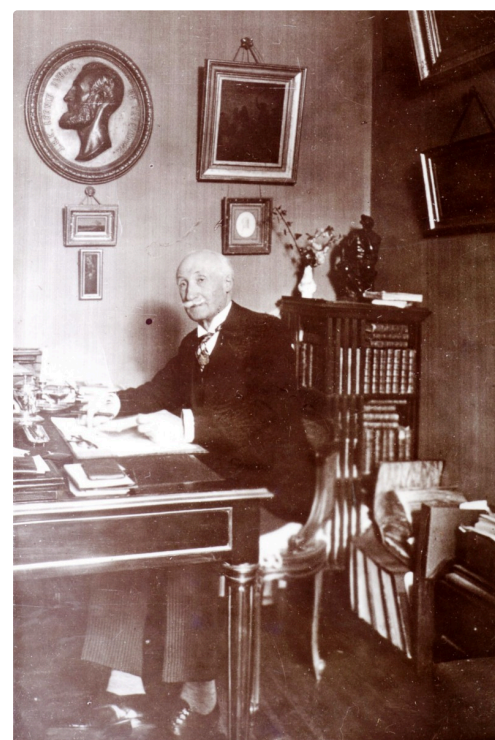
Portrait de Joseph de Pesquidoux