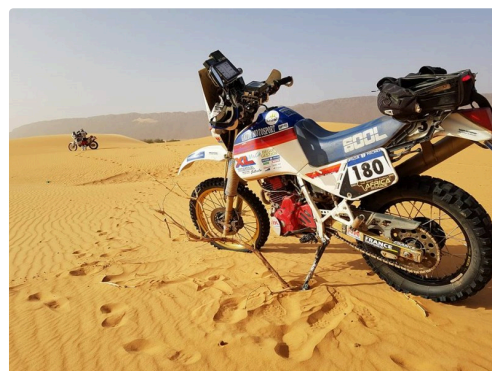
la bête qui fait rêver