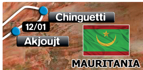
l'étape du jour