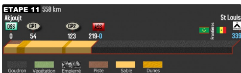
les difficultés du samedi