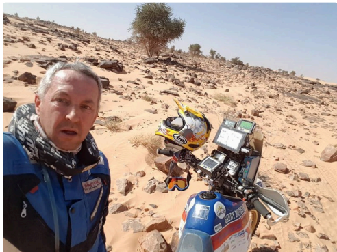
pensif notre pilote gersois