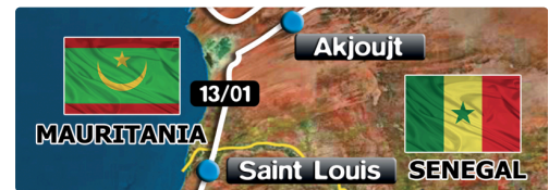
l'étape du samedi