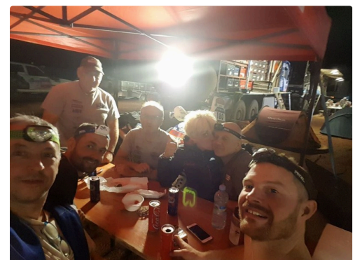
la fine équipe