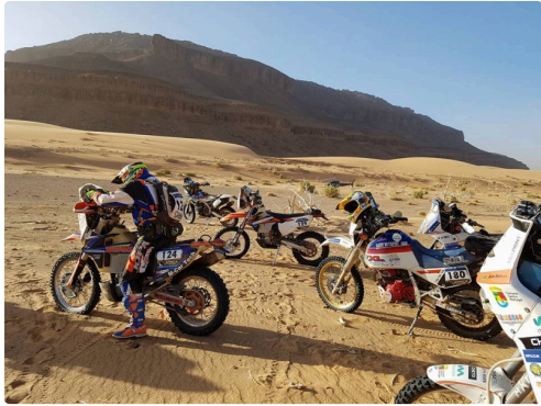
la N° 180 au milieu du troupeau