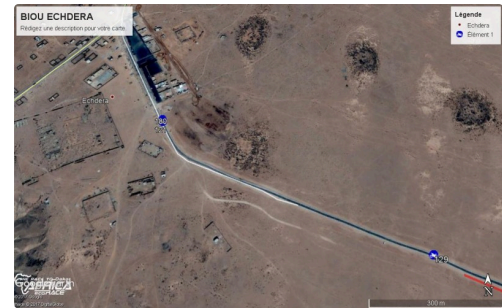
à un instant T du parcours (capture écran google earth)