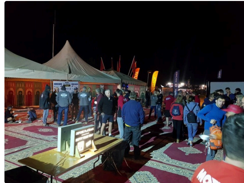
le bivouac