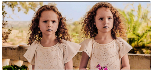
Les deux jumelles de Soleil battant