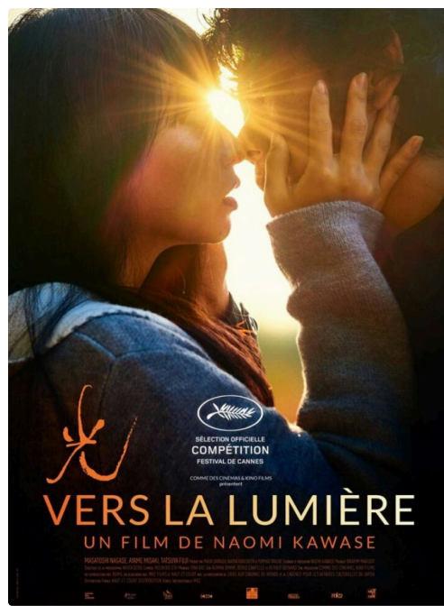
Affiche de "Vers la lumière"