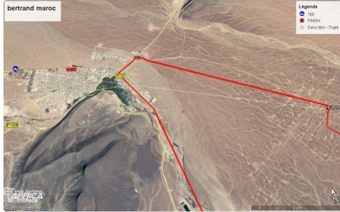
des inquiétudes pour Bertrand en fait non justifiées