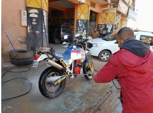
après l'aide à la motarde tombée, un petit tour garage puis un nettoyage pour la 180