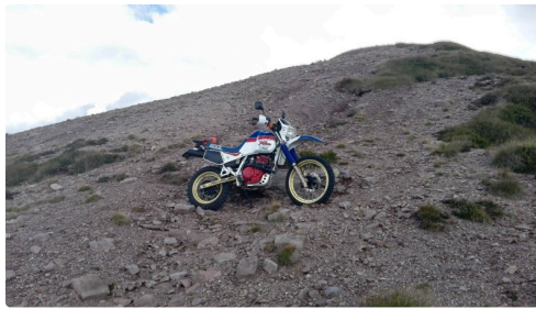
la honda 600 xl de Bertrand sur des cailloux