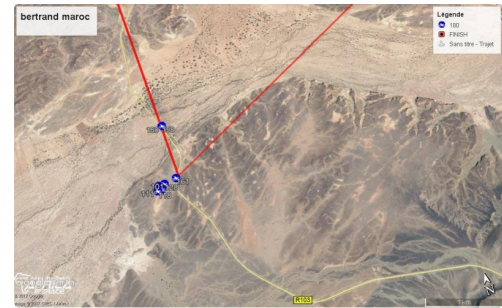
on est rassuré