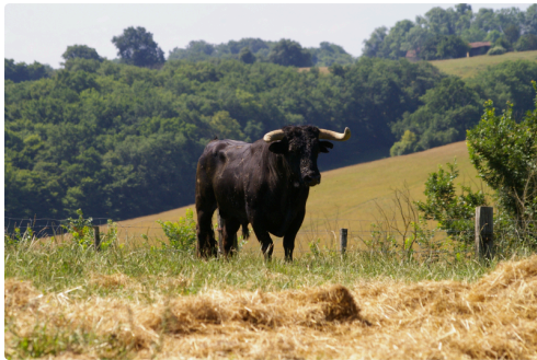
Ce sémental d'origine Jandilla est à la base de la réussite