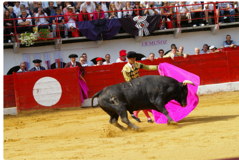
Un novillo de 3 ans 1/2 combattu à Riscle frère de l'excellent présenté à Saint-Sever Samedi