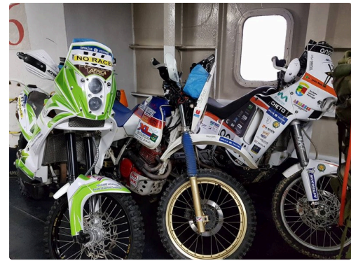
la moto dans le bateau