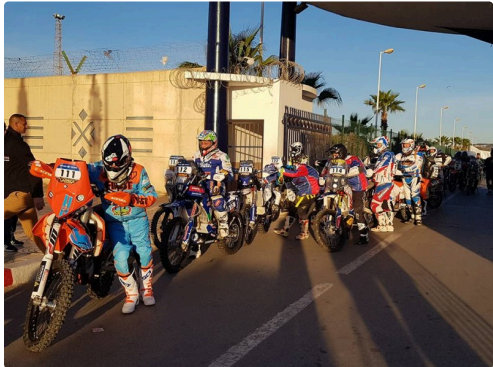
prêts à l'embarquement