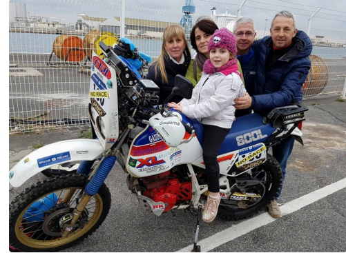
le pilote a le transport en commun moto