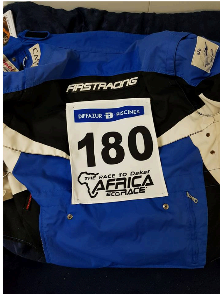
Africa Eco Race suite ce 2 janvier

179 participants au départ sur routes marocaines