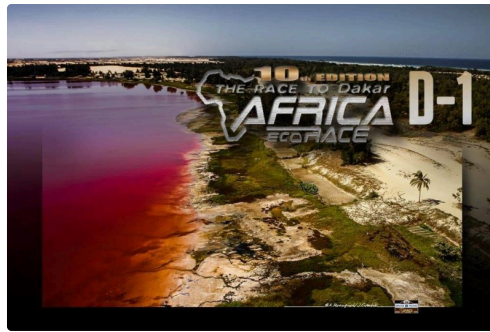
but final le lac rose à Dakar