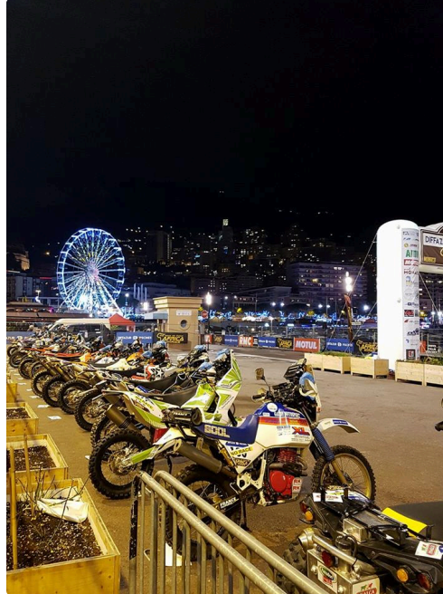
les bêtes dans l'enclos