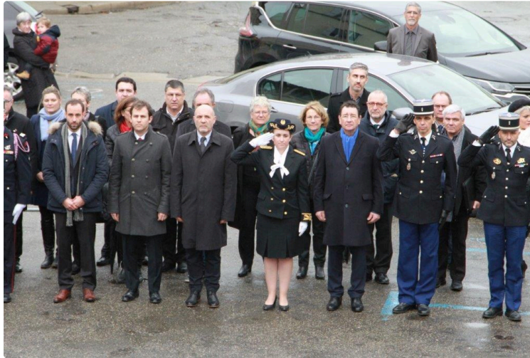
Première sortie officielle pour Isabelle Sendrané désormais sous préfète de Condom.

Nouvelle sous-préfète de Condom Isabelle Sendrané a pris ses fonctions ce mardi matin sous la pluie battante. Première apparition publique officielle, comme le veut la tradition, avec le dépôt d'une gerbe au monument aux Morts en compagnie des autorités locales. Celle-ci recevait ensuite la presse à la sous-préfecture où elle a explicité les grandes lignes de sa mission.