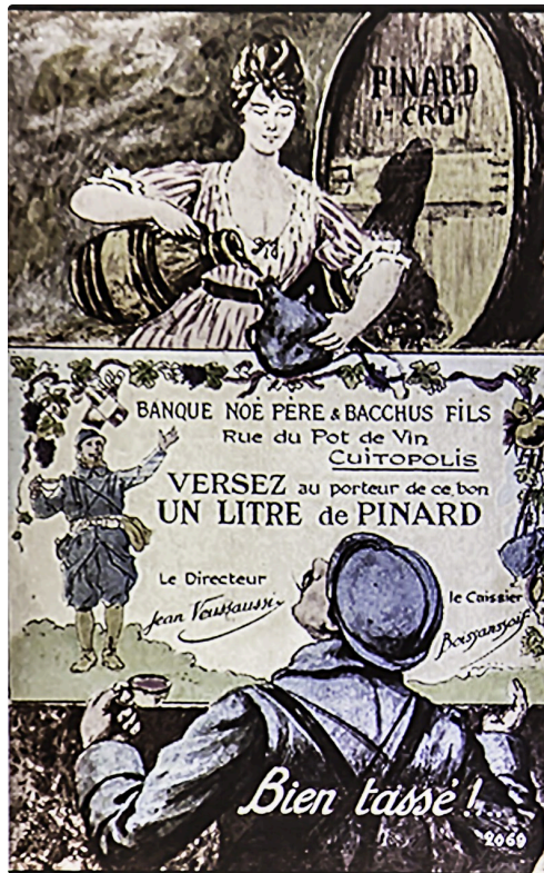
Bon humoristique de pinard - Document projeté par la conférencière