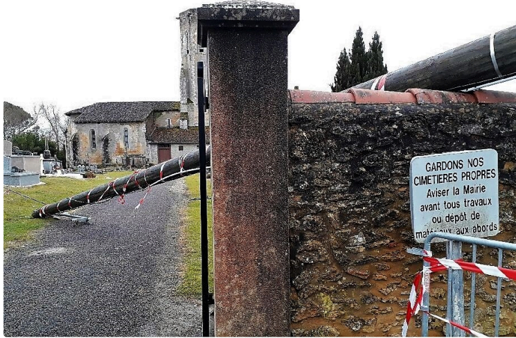
Tempête Bruno : Enedis se mobilise

Trente-neuf agents gersois, quatre de Haute-Garonne en renfort et deux entreprises gersoises sur le pont