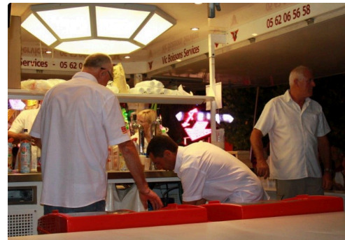
la buvette en action pour vous servir