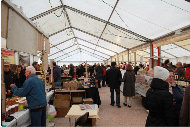
Le comité des fêtes clôture l'année en beauté

Loto à la salle polyvalente le 30 décembre 2017