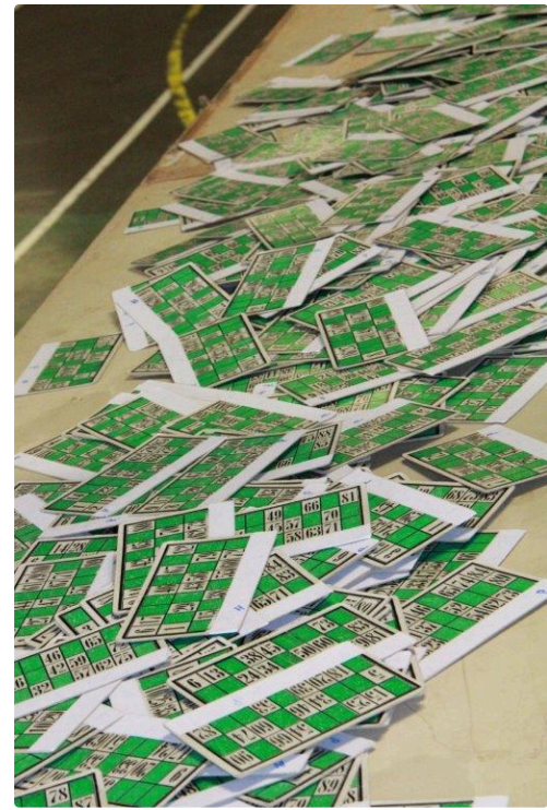
les cartons de la chance ce 30 décembre