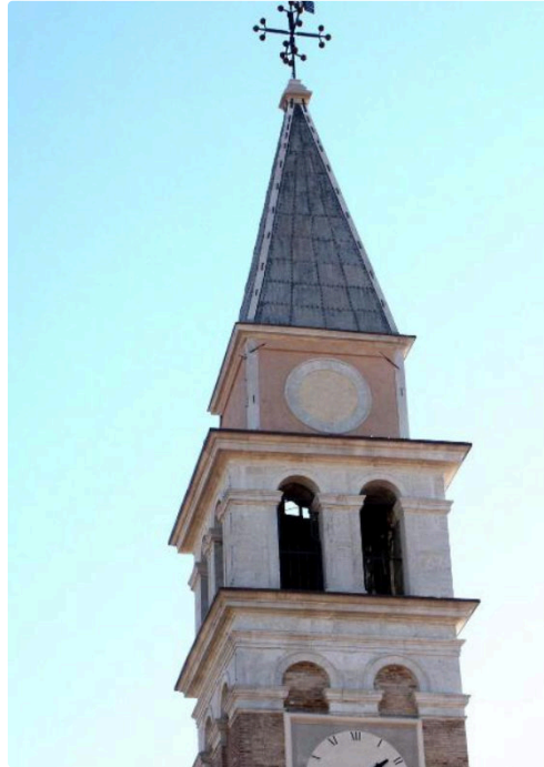
le dôme de Motta di Livenza