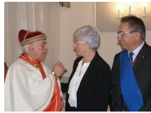
le jumelage Isle/Motta