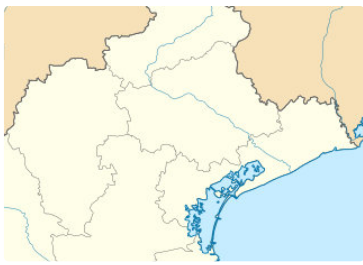
Motta di Livenza en Vénétie