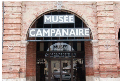
le musée campanaire lislois