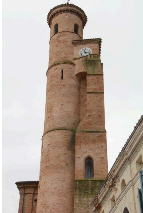
la collégiale lisloise