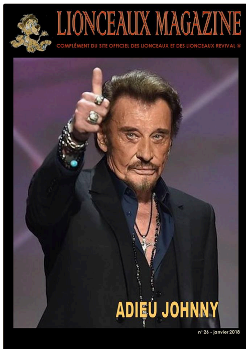
Couverture magazine janvier 2018 "Les Lionceaux" .