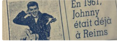
Mon ami Johnny

Le Rémois de naissance que je suis, devenu Gersois d'adoption, tenait à vous parler un peu de ce si grand rocker, qui a émaillé sa jeunesse de merveilleux moments, avec des chansons souvent "rock" mais aussi douces.