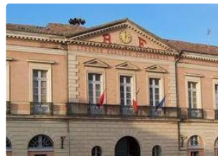
Mairie de l'Isle-Jourdain.