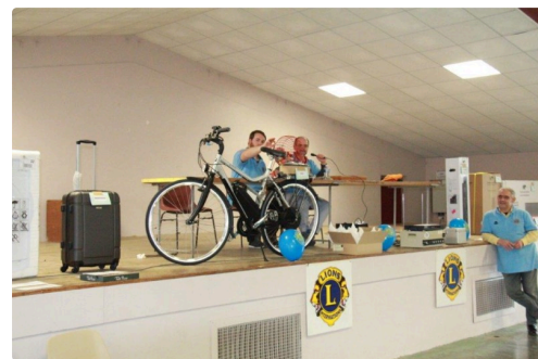
une partie des loto