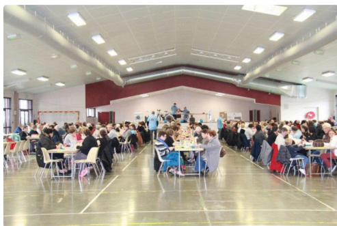
les joueurs de loto