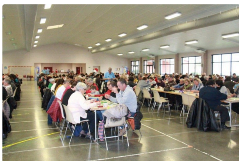
une assistance affairée