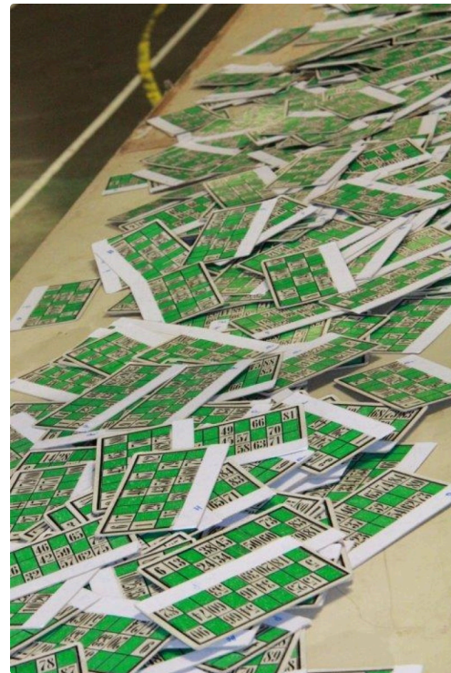
les fameux cartons