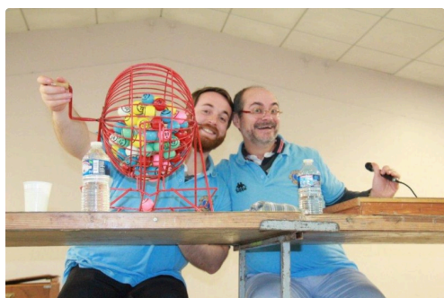
les tourneurs de boules