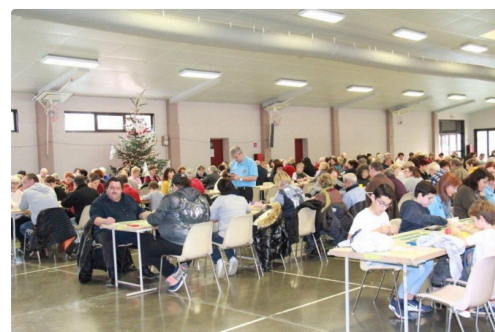
une assistance affairée mais très attentive aussi