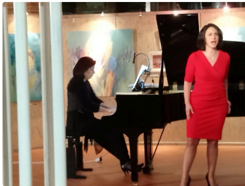
piano et soprano