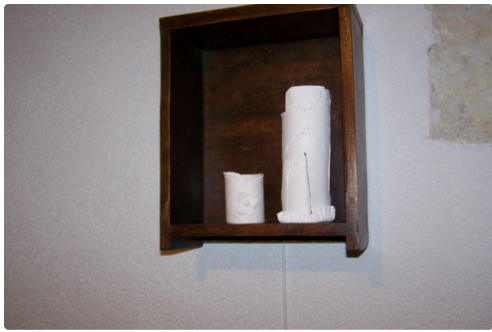
Petites céramiques installées sur un coin d'étagère