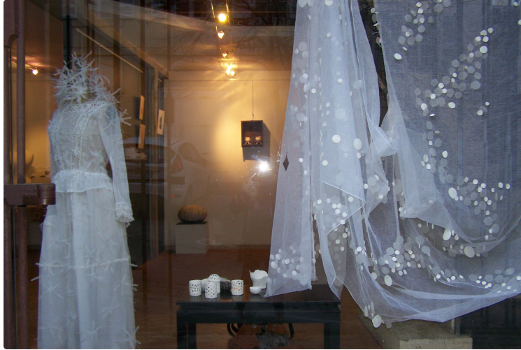
Une mise en scène artistique à la Galerie nou'ARTS

Photo : Une installation sortant des sentiers battus