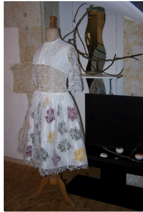
Un mannequin enveloppé de tulle et de fleurs