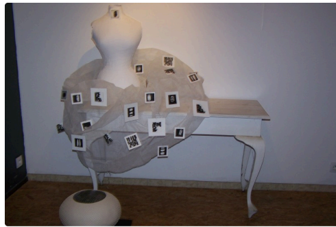
Un mélange d'organza et de gravures