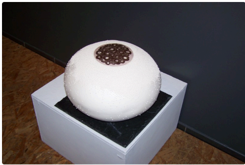
Une boule sous forme de galet incrusté