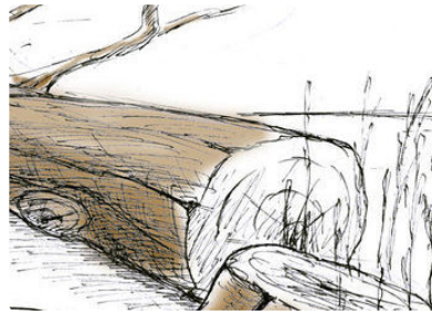
On a abattu le patriarche

Notre petite ville qui grandit un peu trop vite a, ces derniers temps, eu un petit retour en arrière si agréable, grâce à ces querelles de voisinage au sujet du patriarche qui a dû être abattu.