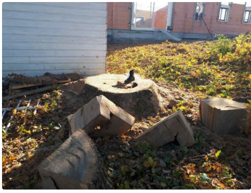
un coeur atteint