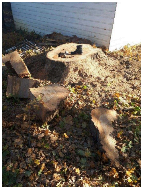
Une souche de belle taille

Les nouveaux habitants ont donc eu raison des anciens au Moulin Saint-Aguet mais la décision prise, l'a été, après mûre réflexion. L'histoire de ces, plutôt sympathiques, petites querelles, façon Clochemerle a donc pris fin avec la mort du vieux chêne. Ces discussions ont eu l'avantage de montrer que notre commune gardait un petit soupçon de ruralité, malgré sa forte expansion démographique.