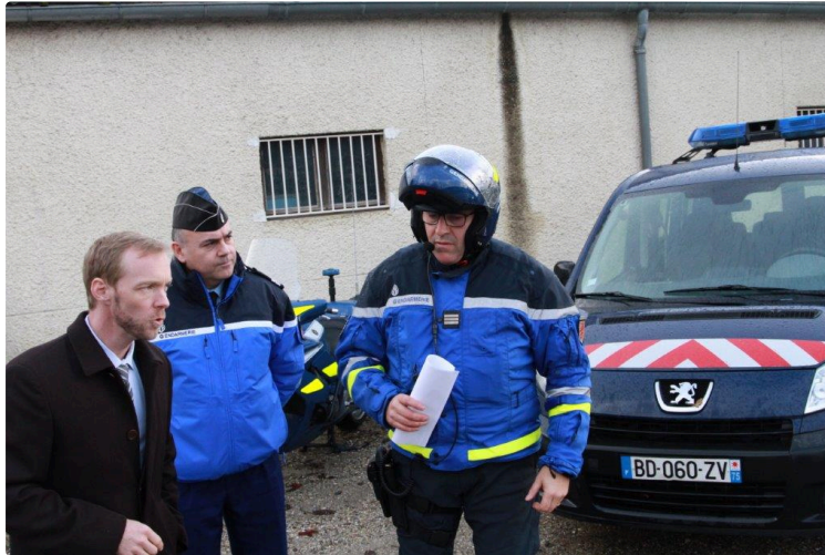
Importante opération de contrôles routiers

63 infractions relevées en deux heures de temps