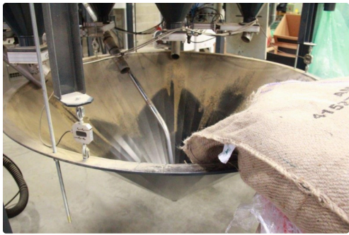
arrivée du café avant torréfaction