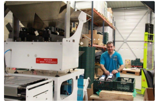
le torréfacteur et conditionneur