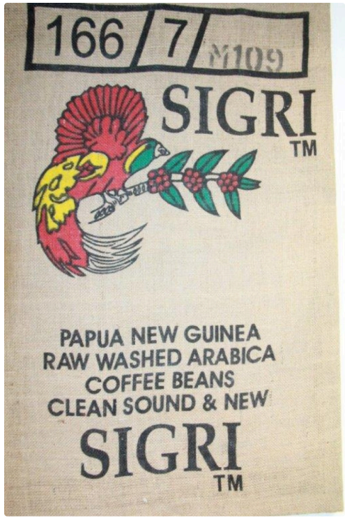
autre autre variété