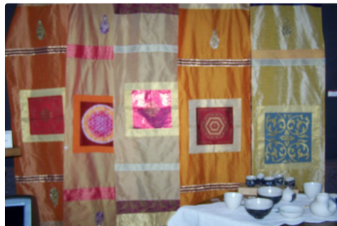
Les longues étoles décoratives de Katja Wentz