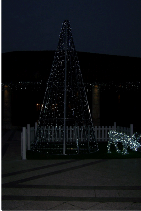
la sapin illuminé sur la place du village