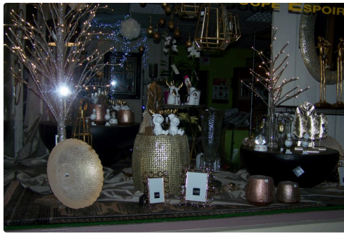
Vitrine décorée dans le village