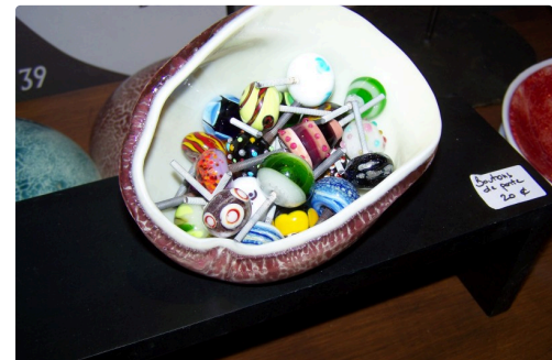
Des boutons de porte en verre, aux belles couleurs vives, d'Agnès Busnel