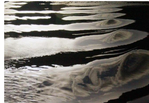
reflets Solange Savino