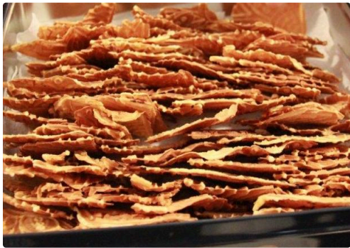
gâteaux au fer