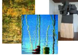
Dernier vernissage de l'année à l'Office de Tourisme

Quatre artistes de talent dans une même exposition