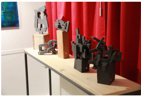
sculptures Marie Savino