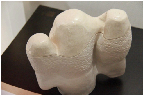
belle sculpture Marie Savino