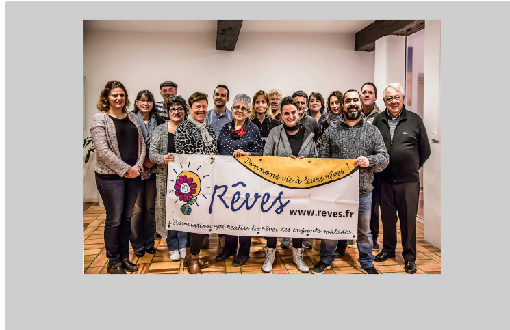
Couloumé-Mondébat – Enguerrand réalise son rêve grâce à Taxis 32

Le jeune malade a rencontré son idole, Rafael Nadal