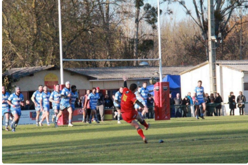
pour des points