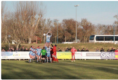
touche à l'adversaire de l'USL