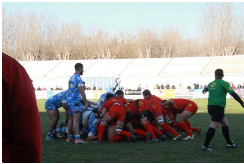
moments du match