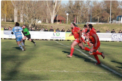
moments du match