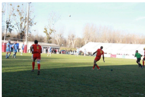
moments du match