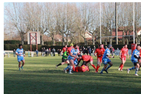
moments du match