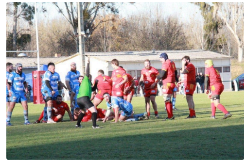
moments du match