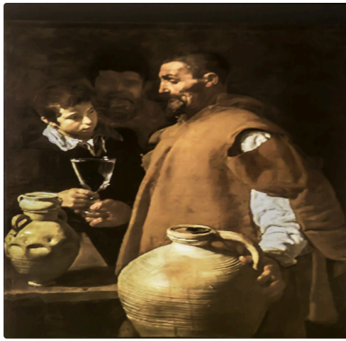
Le porteur d'eau de Seville par Velasquez (1620)