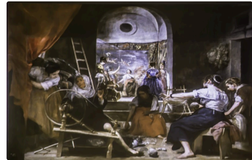
Les Fileuses de Velasquez