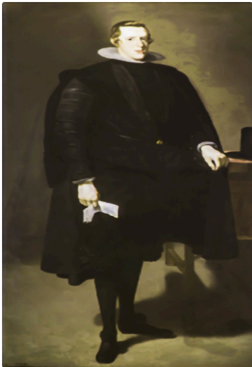
Portrait de Philippe IV par Velasquez en 1623