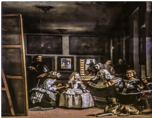
Les Menines de Velasquez