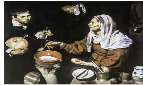
Femme faisant frire des œufs par Velasquez