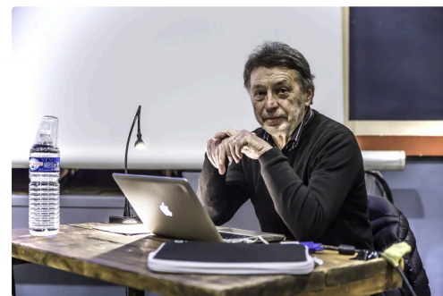
...et pendant celle-ci