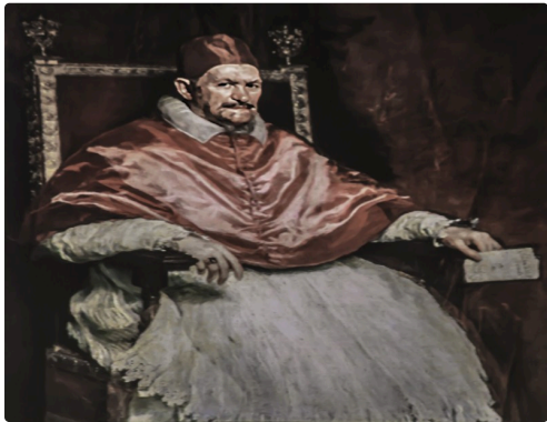
Le pape Innocent X par Velasquez (1650) : "troppo vero !", dit le pape