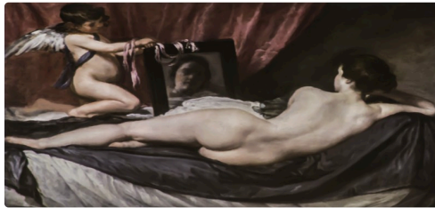
Vénus au miroir de Velasquez (1648)