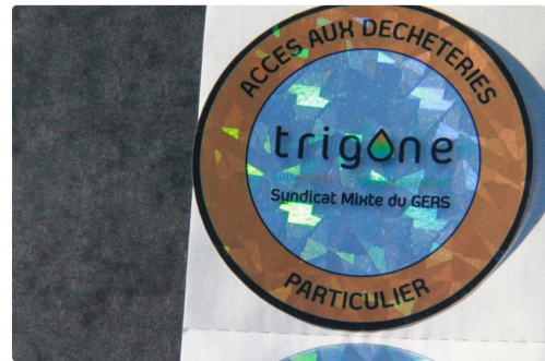
Le macaron pour les particuliers