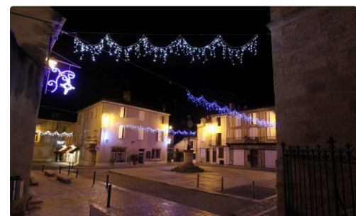
...pour un résultat magique