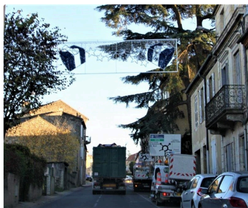
Des installations parfois périlleuses...