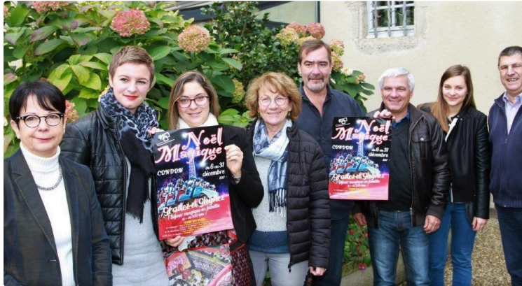
Noël avec les commerçants

La magie de Noël commence toujours avec les illuminations. A Condom, plus de 170 emplacements lumineux avec divers motifs dans les rues et places de Condom (9000 lucioles et quelques 600 ampoules) sont installés pour le plaisir des yeux.