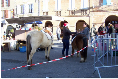
Promenade en poney