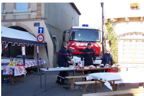
De la restauration sur place proposée par les pompiers

L'association « Pitchounet y Grandet » tient à remercier tous les commerçants colonnais, qui ont joué le jeu en ouvrant leur devanture ou en offrant des lots.