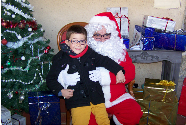
Un marché de Noël original et atypique

Photo : le Père Noël s'est bien arrêté à Cologne