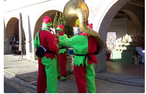
La banda Tintamarre