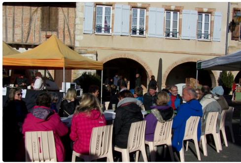
Petite pause pour les randonneurs