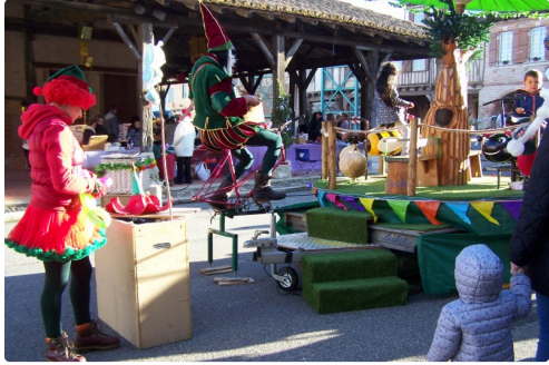
Le manège enchanté animé par un lutin sportif