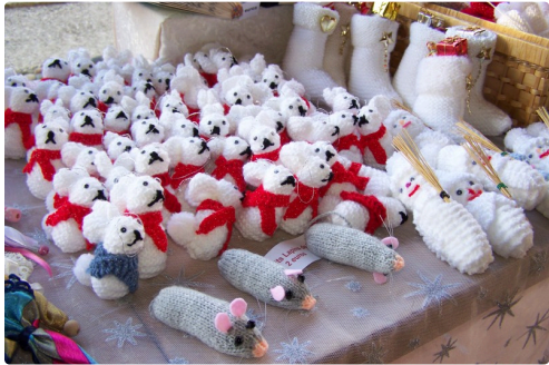
Les petits animaux tricotés à la main