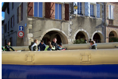
Le baby-foot a trouvé des fans !