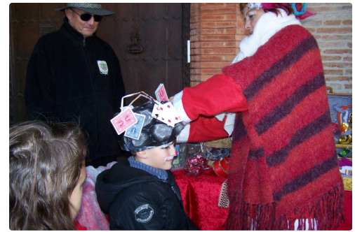
Le chapeau de cartes réalisé par Evelyne B