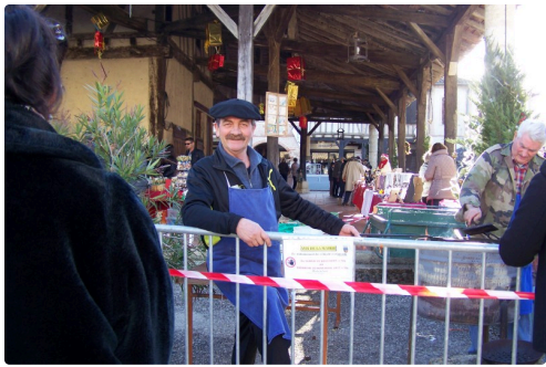
Chauds les marrons, chauds !!!