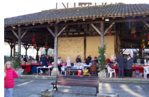
Petite vue des stands sous la halle