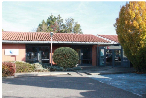
la salle où se sont jouées les rencontres