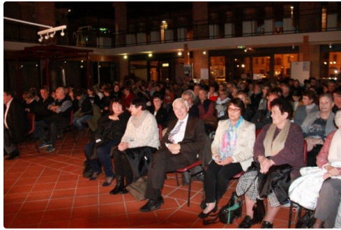
une partie des autorités devant le public