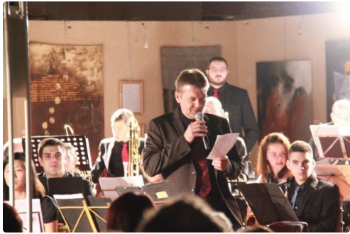
petit discours de présentation