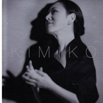
concert de la Sainte-Cécile au Musée Campanaire

Samedi, en fin d'après-midi vers 18h30, pour célébrer la Sainte Cécile, Sainte-Patronne des Musiciens , la Société Philharmonique Lisloise (plus vieille société musicale du Gers fondée en 1840 et forte de plus de 50 musiciens), accueillait en cette magnifique salle, une foule imposante de mélomanes et autres personnes, avides d'un beau spectacle, comme elle le fait chaque année, en fin d'automne.