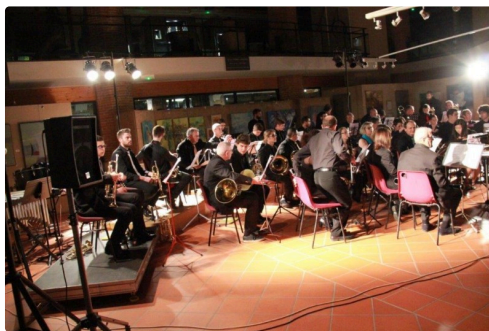
l'orchestre de la société philharmonique de l'Isle-Jourdain