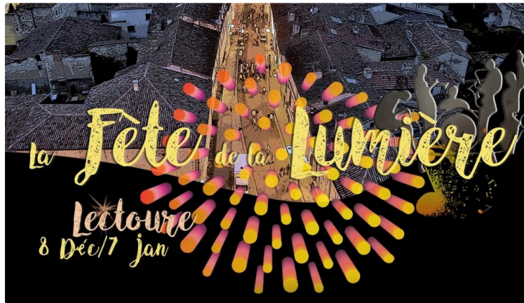
Ouverture de la Fête de la Lumière

A l'approche des fêtes de Noël, Lectoure prend les devants.