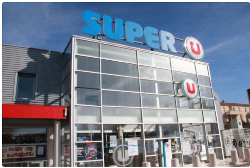
le Super U lisois