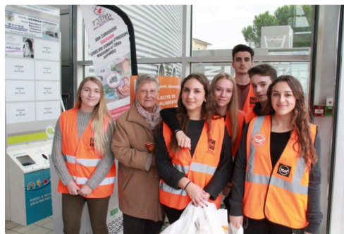
collecte au Super U