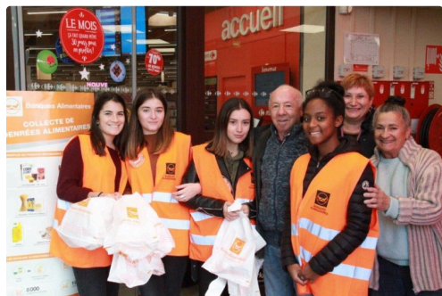
collecte à carrefour market

Un grand coup de chapeau à tous ces bénévoles et aux sympathiques donateurs.