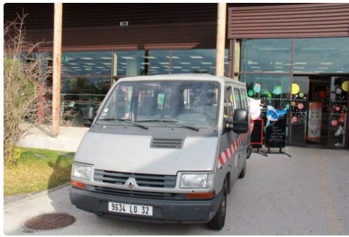
le Carrefour Market lisois