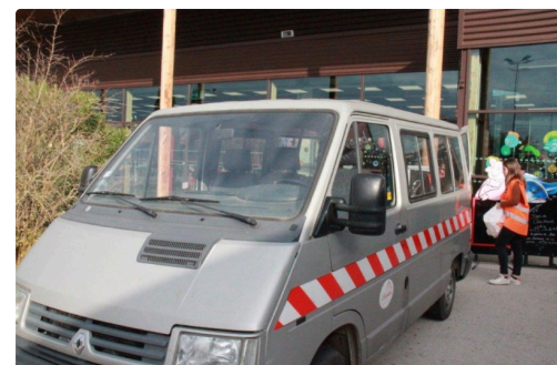
véhicule, prêté par la mairie lisloise, pour stock et transfert des donnes et produits offerts