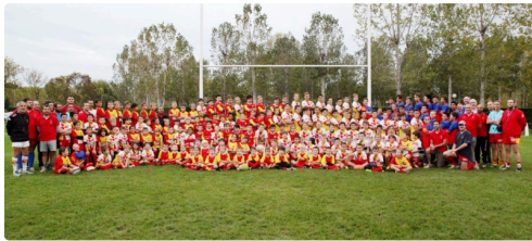
l'ensemble des jeunes du club