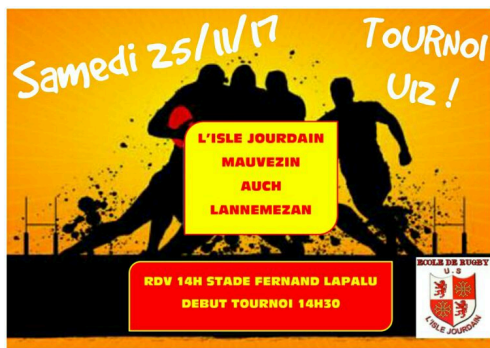
prochain match des jeunes le 25 novembre