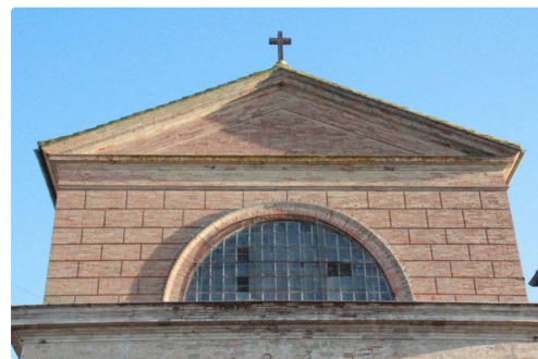
entrée de la collégiale