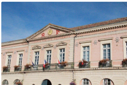
la mairie pour le budget alloué aux travaux