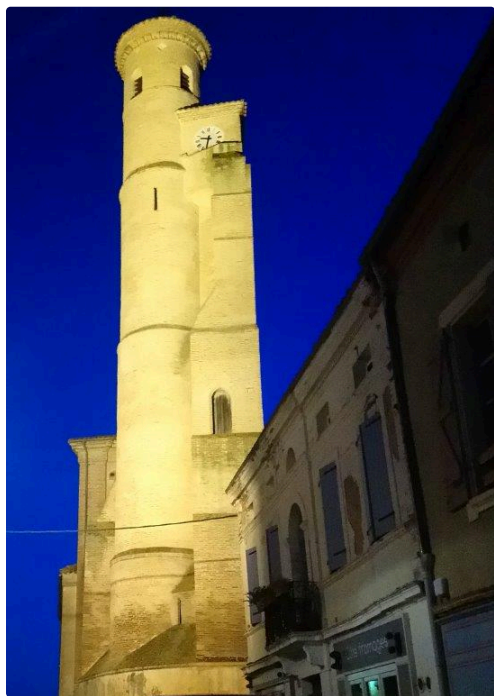
tour de la collégiale

En l'absence de questions, le Président a clôturé cette assemblée générale et offert le verre de l'amitié aux présents.