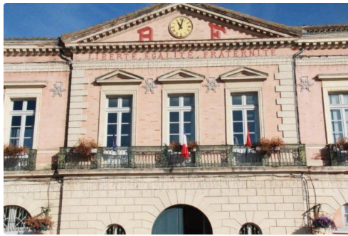
Lieu de la réunion : Mairie lilloise