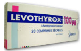
Lévothyrox : nouvelle formule