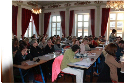
concurrents durant l'épreuve