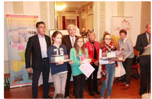
Les promues collège