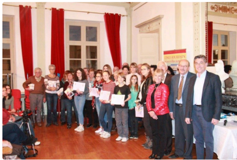
l'ensemble des primés