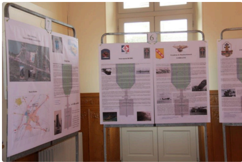
Autres panneaux d'hommage