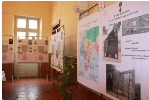
L'exposition du Salon Rouge "Les Compagnons de la Libération"