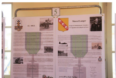
Divers panneaux d'hommage