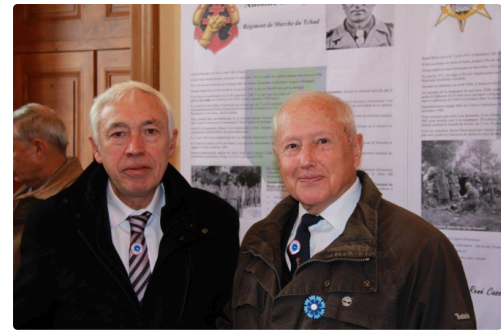
Le Maire et le Président