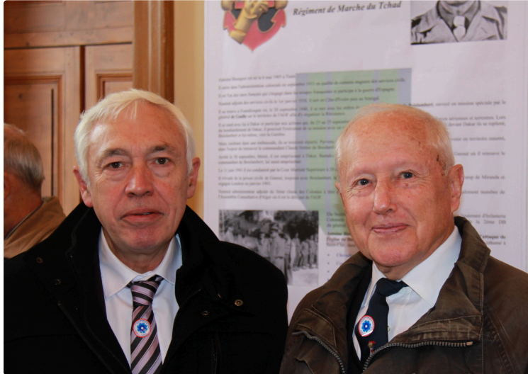
EXPOSITION "LES COMPAGNONS DE LA LIBERATION"

Au Salon Rouge de la Mairie du 9 au 29 novembre