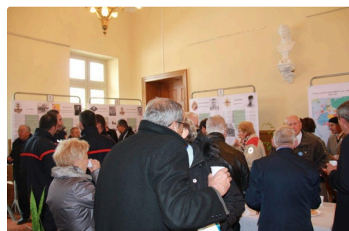
Le verre de l'Amitié au sein de l'exposition

En conclusion on peut confirmer que notre commune mérite bien ce qualificatif de « Lieu de Mémoire et du Souvenir », et nous vous invitons donc, à vous rendre nombreux, dans ce salon rouge de la Mairie, pour vous remémorer tous ces événements, et rendre à votre tour un hommage aux Compagnons de la Libération.