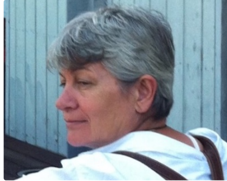
De surprenantes créatures aquatiques ...

Nouvelle exposition à l'Office de Tourisme de la Gascogne Toulousaine de l'Isle-Jourdain