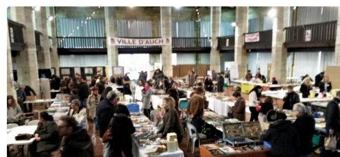
Les amateurs à la recherche de leur bonheur