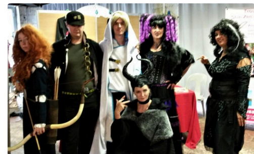
L'association Késaco, très remarquable