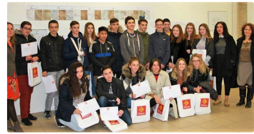
Les élèves et leurs professeurs