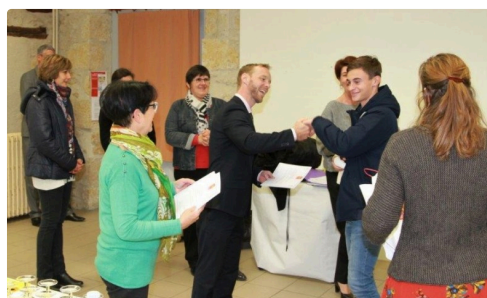
L'ambiance était joyeuse lors de la remise des prix