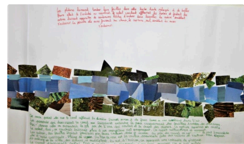
Extrait de la frise