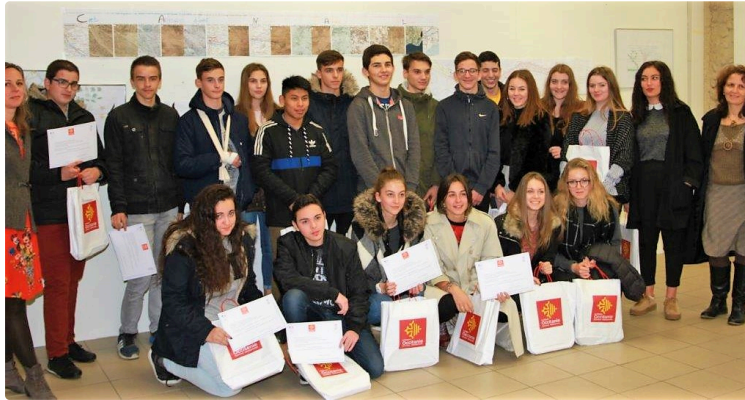
Prix du patrimoine mondial en Occitanie : les lycéens condomois récompensés

Les élèves de 2nde du lycée Bossuet de Condom ont obtenu la deuxième place (sur 943 élèves et 46 projets), au Prix du patrimoine mondial en Occitanie, en présentant leur carnet de voyage sur le Canal du Midi : "L'un vers l'autre, laisser couler le temps".