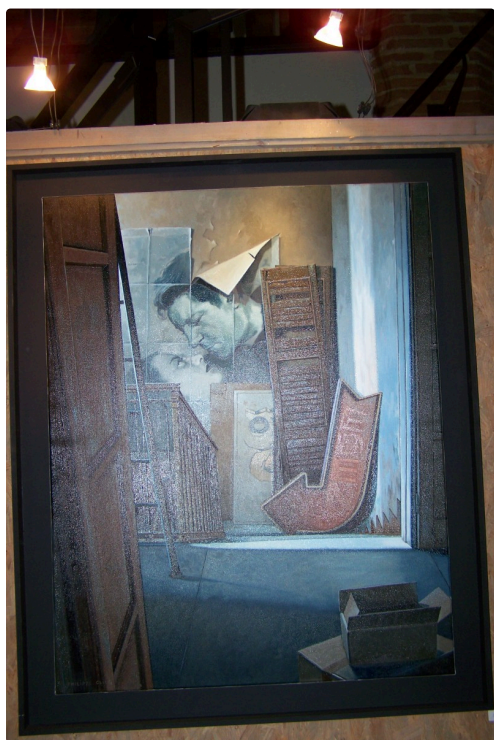
Une de ses toiles, qu'évoque -t-elle pour vous ? certainement une scène emblématique de cinéma entre Gabin et Morgan...une belle réalisation !