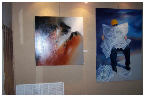
"Clairvoyance" de Marie-Claude Lamarche, artiste peintre varoise qui fut invitée d'honneur l'an dernier à Samatan...accompagné " Les Nouvelles" toile acrylique de l'artiste peintre Julius