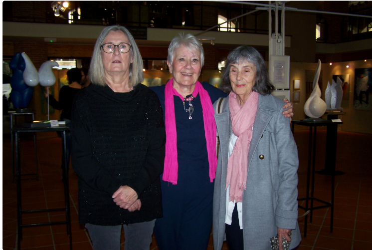
17ème Salon des "Muses d'Europe" au Musée Campanaire de l'Isle-Jourdain