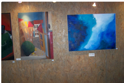
"Silence" de l'artiste peintre Michèle Lambert avec ses bleus profonds, énigmatique titre;;;mer ou montagne...au visiteur de le découvrir !!!!