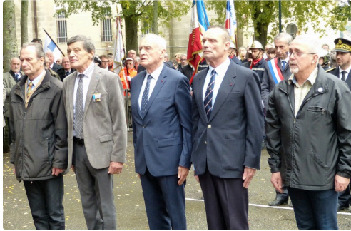
les représentants des associations des anciens combattants.