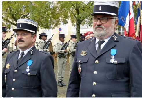
les récipiendaires de l'ordre national du mérite.