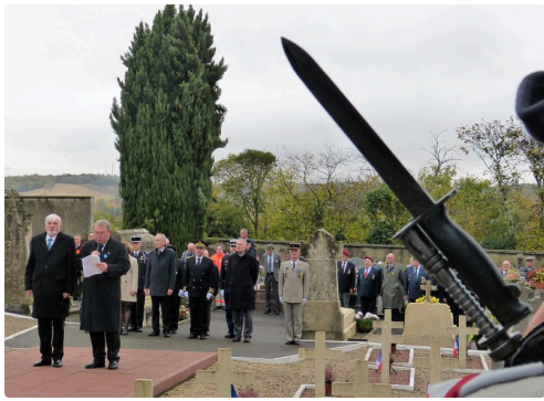
Carré militaire ; appel aux morts pour la France.