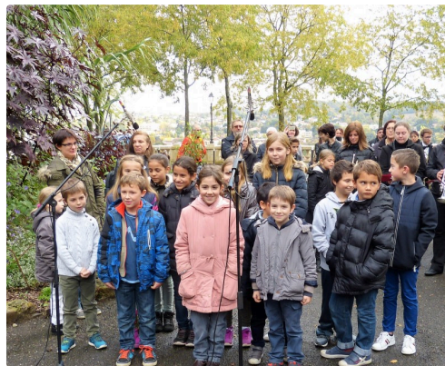
les écoliers et la marseillaise.