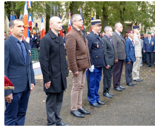
les récipiendaires de la croix du combattant.