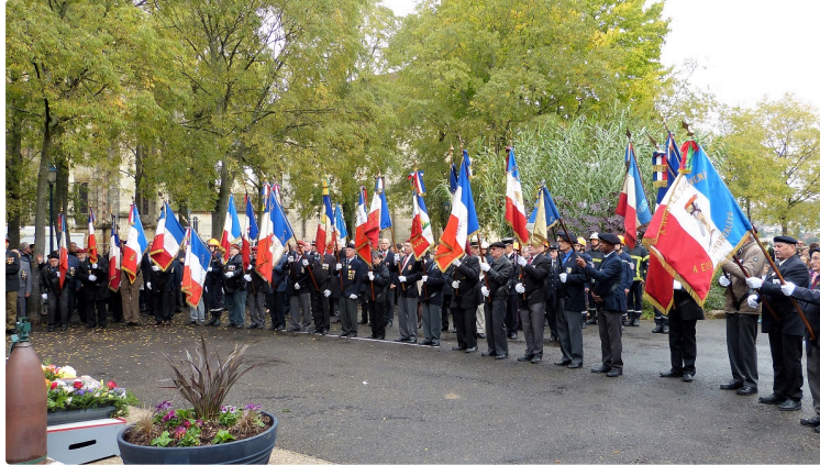
Auch ; les cérémonies du 11 novembre.

Le 11 novembre célèbre à la fois l'Armistice du 11 novembre 1918, la commémoration de la Victoire et de la Paix et l'Hommage à tous les morts pour la France.