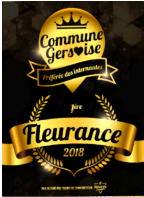
Commune préférée des Gersois 3 25 10_InPixio_InPixio.png