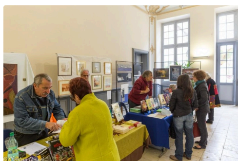
festival bizarre 2017 -99.jpg