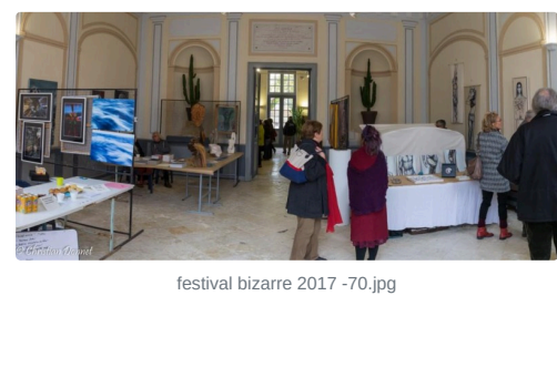
festival bizarre 2017 -70.jpg