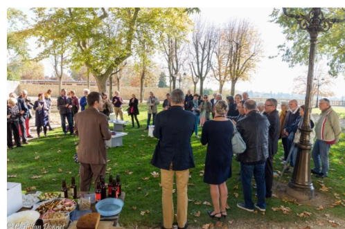
festival bizarre 2017 -51.jpg