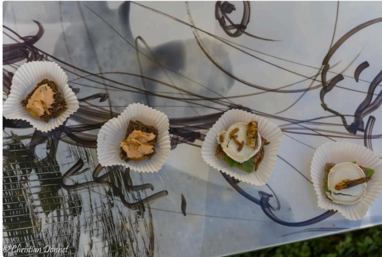
Lecture - Les bizarreries sont passées par là

Le public a répondu présent ce week-end pour assister aux « bizarreries » qui se déroulaient aux quatre coins de la ville. Il faut dire qu'il y en avait vraiment pour tous les goûts et tous les âges.