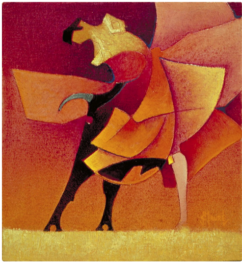
Tauromachie JC Maurel