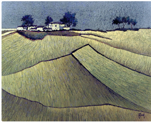
champ de colza JC Maurel