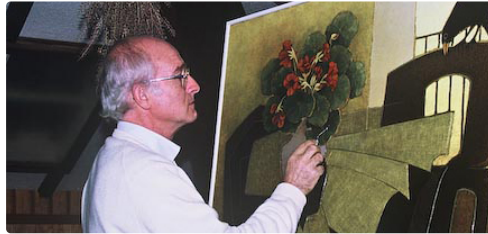
SAINT MARTIN Salon d'automne