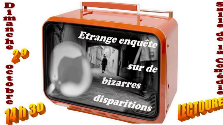
Le festival Bizarre en mode loufoque