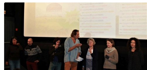
Les membres du jury