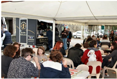
Le coin restauration