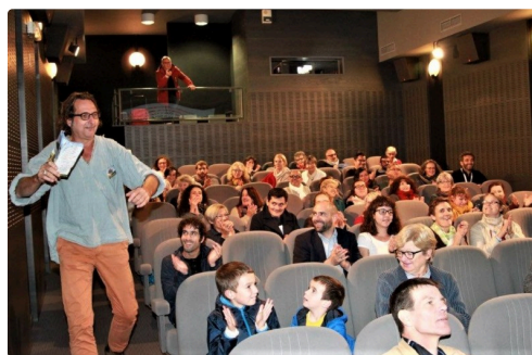
Un public présent au rendez-vous