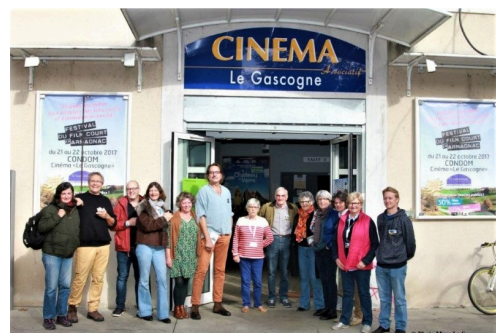
Le Gascogne prêt pour le Festival